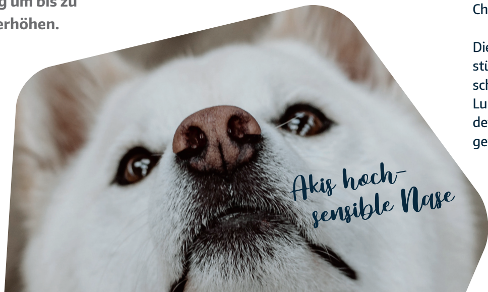
Akis hochsensible Nase